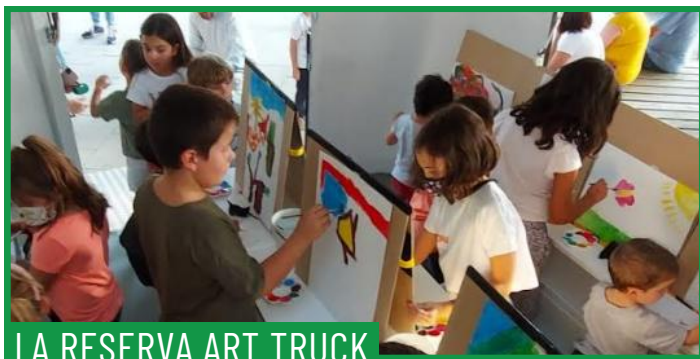
LA RESERVA ART TRUCK

Farem torns de 20 minuts en grups de 8. Porta roba que es pugui tacar!