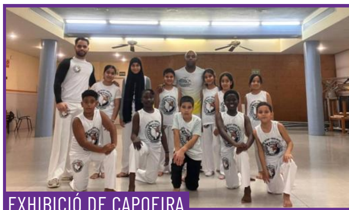
EXHIBICIÓ DE CAPOEIRA

Mostra de dues danses folklòriques bolivianes. El Salay, originària de Jaihuayco, zona popular de la ciutat de Cochabamba. La seva forma actual neix del diàleg entre el zapateig propi dels valls bolivians i ritmes tradicionals com el huayño i el salaque. I el Tinkus, típic de les regions de Potosí i Oruro, que simbolitza l'encontre cerimonial entre comunitats; un ritual anterior a l'època inca, que avui es continua celebrant durant la festa de la Creu, en honor a la Pachamama (mare terra).