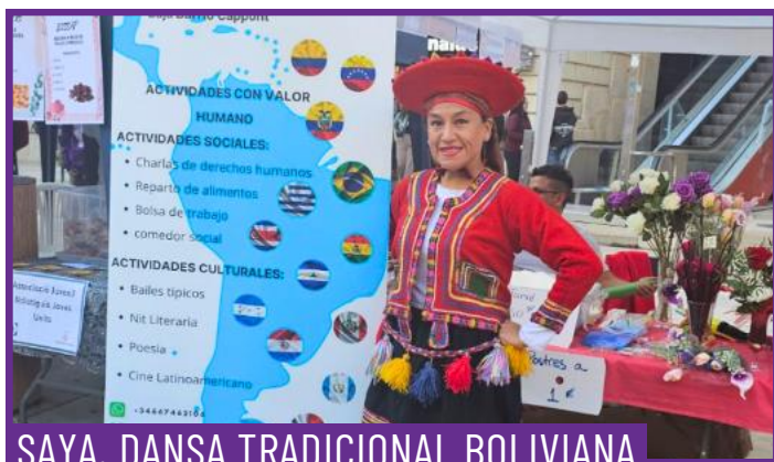
SAYA. DANSA TRADICIONAL BOLIVIANA