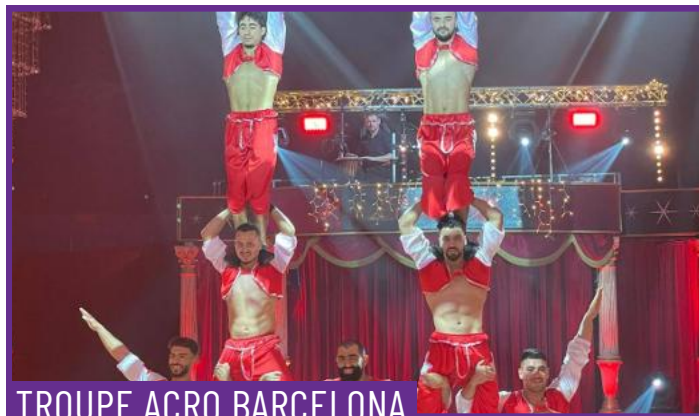
TROUPE ACRO BARCELONA

Trio de força és una peça d'acrobàcia de 10 minuts en què tres artistes construeixen figures i piràmides humanes, posant en joc la força, l'equilibri i la confiança. La companyia Acro Barcelona presenta una proposta directa i física, hereva del circ tradicional.