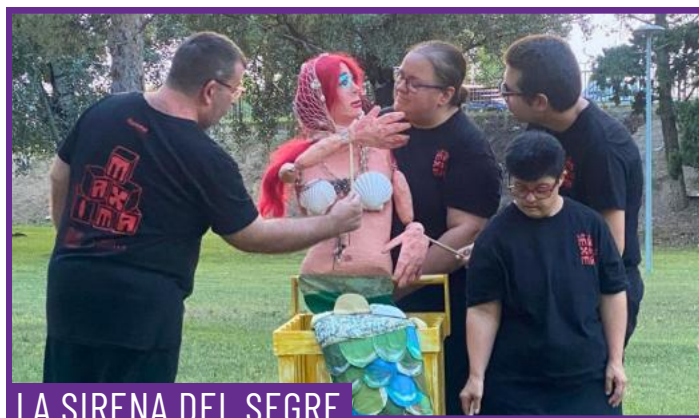
LA SIRENA DEL SEGRE

El Ball de bastons, o Ball de Bastonets, com s'ha anomenat històricament a Lleida, és el ball festiu més arrelat i que més temps s'ha mantingut en actiu a la Festa Major de Lleida, tenint-ne ja notícies a principis del segle XVIII. Tot i que La Colla Bastonera del Pla de l'Aigua és una colla jove, no deixa de banda els aspectes històrics del Ball de Bastons de Lleida, incorporant hi energia, força i visibilitat!