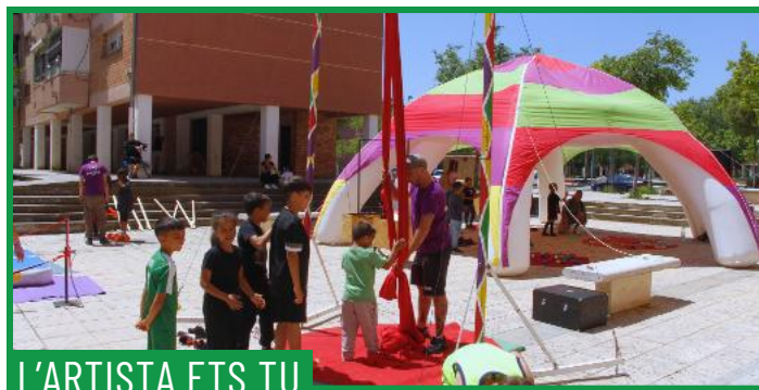
L'ARTISTA ETS TU

Dissabte matí i tarda. Diumenge només matí.