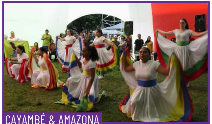
CAYAMBÉ & AMAZONA

L'Eboleza és una dansa tradicional de l'ètnia fang, pròpia de Guinea Equatorial, que es balla habitualment en contextos festius i celebracions comunitàries. Es caracteritza per un ritme intens i dinàmic, amb moviments ràpids i girs, acompanyats de cants que reforcen el caràcter col·lectiu i expressiu de la peça.