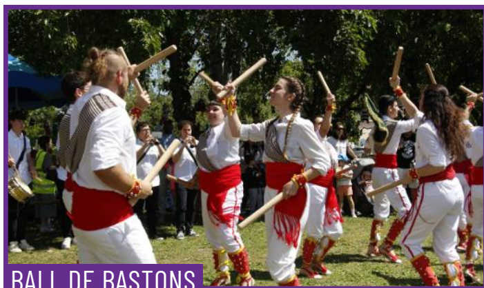
BALL DE BASTONS

Actuació de guitarra protagonitzada per diferents grups d'alumnat sènior d'arreu de la ciutat, que interpretaran un repertori de música tradicional, acompanyats pels seus mestres, músics professionals. Una proposta que recupera sons i melodies de la cultura popular, interpretades des de l'experiència i el compromís de la gent gran amb la vida cultural del municipi.