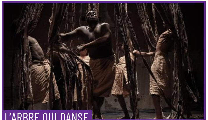
L'ARBRE QUI DANSE

És la història de dos babaus: bruts i sense res. Observen el món passar, d'incògnit... I com que tu també hi ets, en trauran profit. Rondinaires però riallers, babaus però espavilats, es riuen de l'autoritat i les convencions, i s'ho passen bé trencant la insuportable monotonia de la vida. La companyia desenvolupa un llenguatge basat en el teatre físic, el clown i la manipulació d'objectes. Les seves creacions combinen humor i poesia en universos escènics propis, construïts des del cos, la música i el joc.