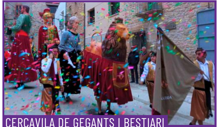
CERCAVILA DE GEGANTS I BESTIARI

Desfilada de caftans que posa en valor l'elegància i la riquesa de la indumentària tradicional marroquina. El caftan és una peça clau en celebracions i ocasions especials, símbol de distinció i identitat cultural. A través d'aquesta passarel·la, el públic podrà gaudir de la seva estètica única i del treball artesanal que hi ha darrere de cada disseny. Una proposta visual i festiva que convida a descobrir el caftan com a expressió viva de la tradició i l'estil del Magreb.