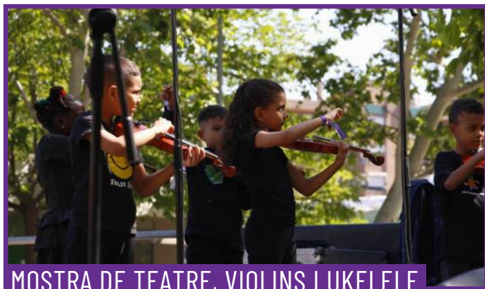
MOSTRA DE TEATRE, VIOLINS I UKELELE