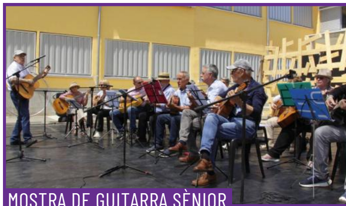
MOSTRA DE GUITARRA SÈNIOR

Alumnat de l'Escola Magí Morera i Galícia mostra el treball que han estat realitzant durant el curs: classes de música en les quals han après a tocar el violí i l'ukelele, i taller de teatre.