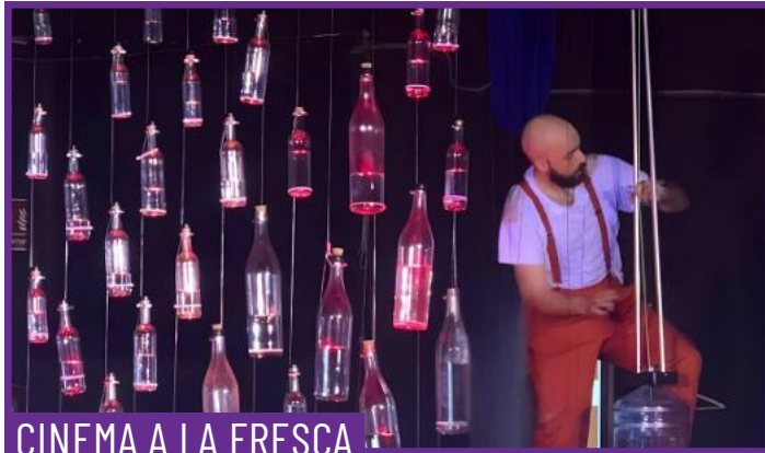
CINEMA A LA FRESCA