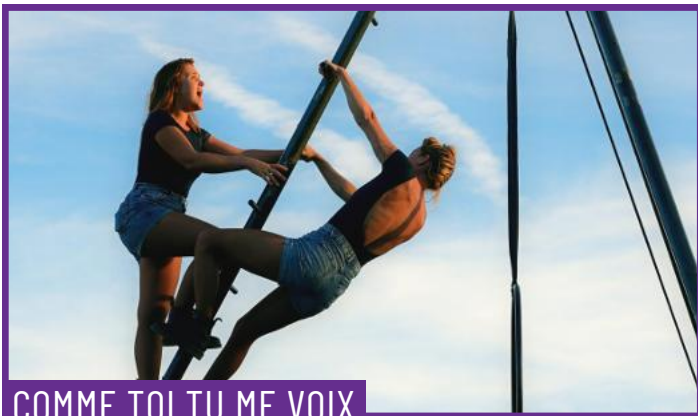
COMME TOI TU ME VOIX