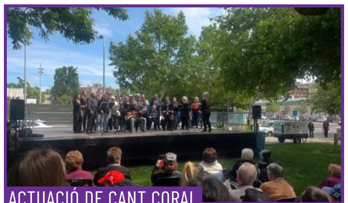
ACTUACIÓ DE CANT CORAL

T'atreveixes a transformar-te a l'escenari de Sienta la Cabeza? Un espectacle de perruqueria artística, a ritme de música que convida el públic a participar com a protagonista d'un canvi d'imatge radical i efímer, que el transformarà per un dia, o potser per sempre. Gaudeix amb la música i deixa't impregnar per l'experiència de viure o veure canvis d'imatge radicals i insòlits, que no deixaràn ningú indiferent.