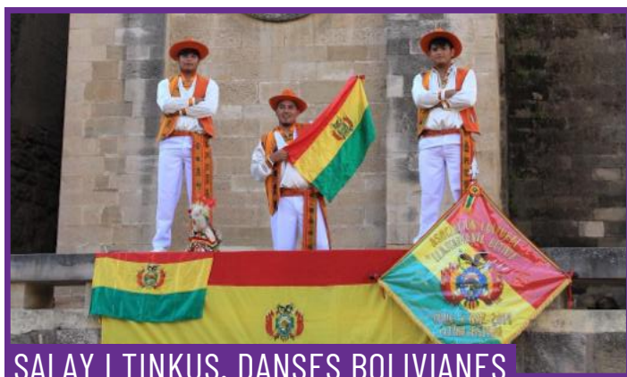
SALAY I TINKUS. DANSES BOLIVIANES

La ghyata jablia és una expressió musical pròpia de les regions muntanyoses del nord del Marroc, especialment vinculada a les comunitats jbliya, i forma part essencial de les celebracions populars com festes tradicionals, casaments i trobades comunitàries, on la música esdevé un element central d'identitat i cohesió social.