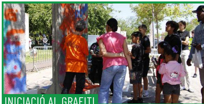
INICIACIÓ AL GRAFITI

Una invitació a descobrir els paisatges dels Pirineus en una instal·lació que combina l'art, l'artesanía, la mecànica i el joc. Inspirades en les hipnòtiques i complexes màquines de bales, reinventem el seu funcionament perquè el públic interactuï amb elles usant elements mecànics, creant desafiaments d'enginy i habilitat en què simula el camí d'ascens o descens d'una muntanya als Pirineus.