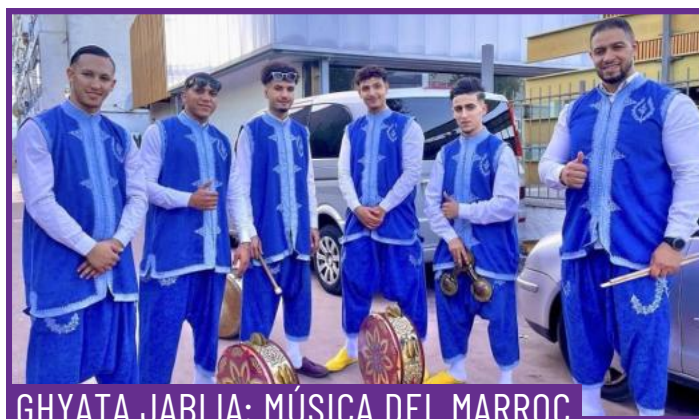
GHYATA JABLIA: MÚSICA DEL MARROC

El Centro Latinoamericano de Lleida presenta una dansa tradicional. La Saya Boliviana, d'origen ancestral que combina ritme, cant i moviment com a expressió de resistència i identitat cultural. Es caracteritza per la seva força rítmica i expressivitat.