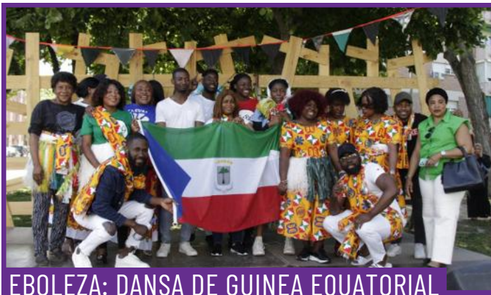
EBOLEZA: DANSA DE GUINEA EQUATORIAL

Cercavila de gegants i bestiar que recorrerà els carrers amb música i ritme. El Grup Cultural Garrigues treballa en la preservació i dinamització de la cultura popular, participant activament en actes festius i en la transmissió del patrimoni immaterial. Aquesta actuació s'emmarca també en la tradició impulsada pel Patronat del Corpus de Lleida, entitat clau en la conservació i promoció de les festes tradicionals de la ciutat, especialment vinculades al Corpus i al seguici festiu.