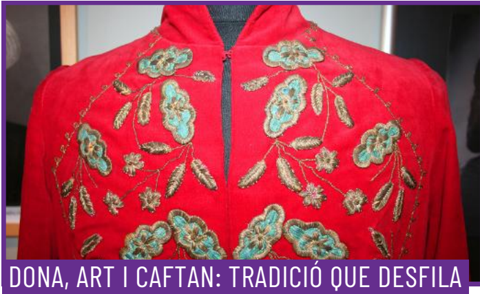
DONA, ART I CAFTAN: TRADICIÓ QUE DESFILA